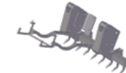
Escarificador trasero o ripper